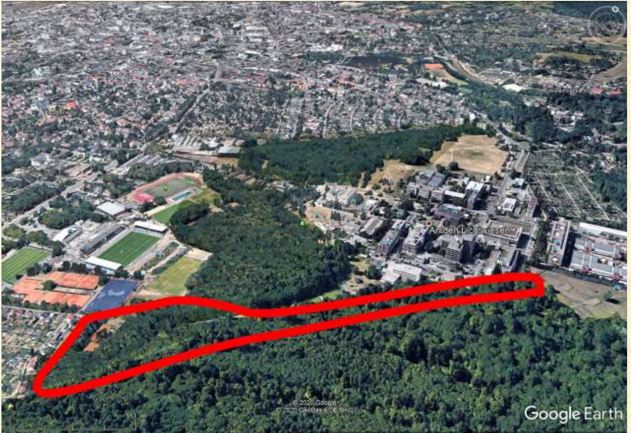
Darmstadt-Lichtwiese, Blick nach Norden