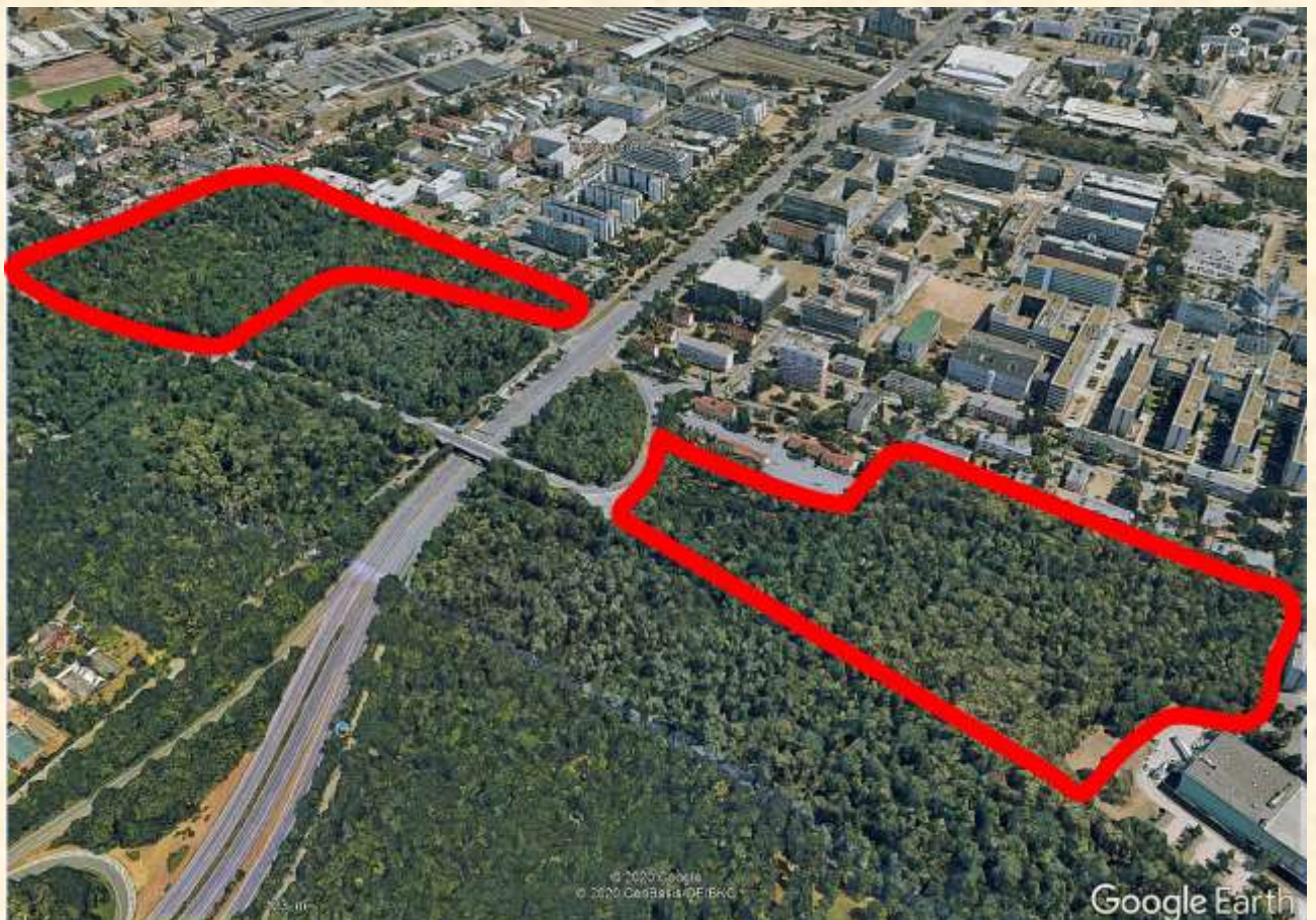
Darmstadt-West, Blick nach Osten