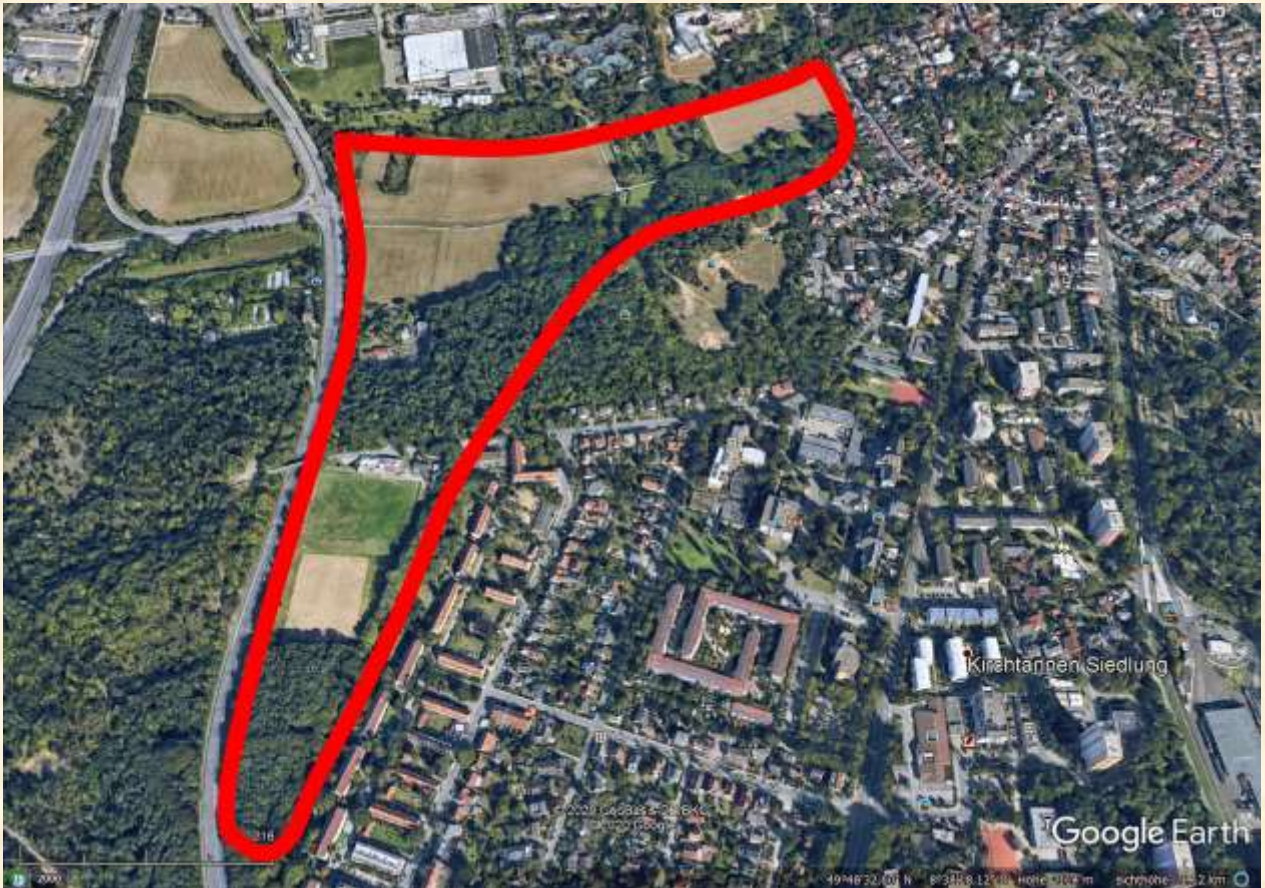
Eberstadt Südwest, Blick nach Norden