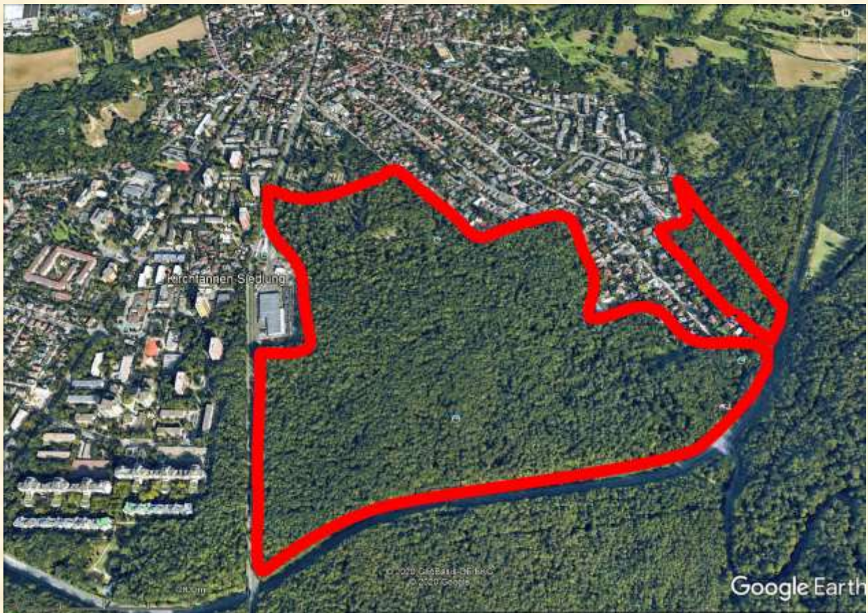
Eberstadt Südost, Blick nach Norden