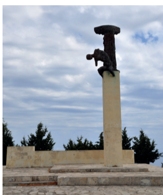
Amiras/Viannos Gedenkstätte für 451 hingerichtete Menschen

Zwei kombinierte Ausstellungen stehen im Mittelpunkt der Reihe, dazu eine Lesung, ein Vortrag, eine Filmdokumentation sowie eine Filmreihe im programmokino rex.